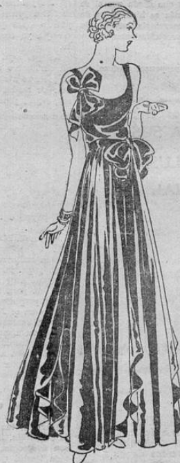
Traje de noche, de satín negro, con grandes lazos en el talle y el hombro izquierdo