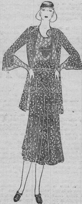
Modelo de tela adornada con puntos blancos o rojos. Nótese el original dibujo de la falda