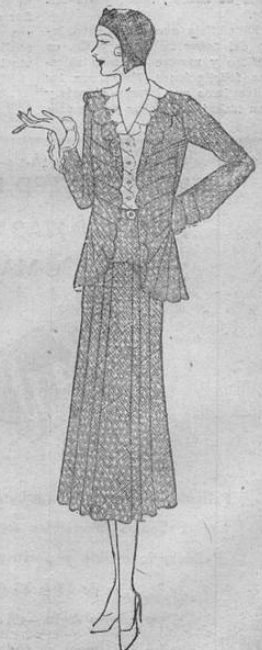
Modelo de seda azul, adornada a puntos. Sus líneas severas añaden gentileza a la figura