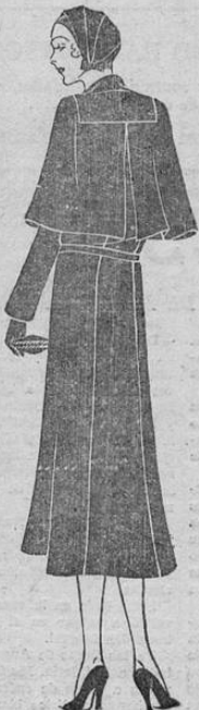
Abriego de lana azul marino. Lieva una capa en pliegues y faja delgada